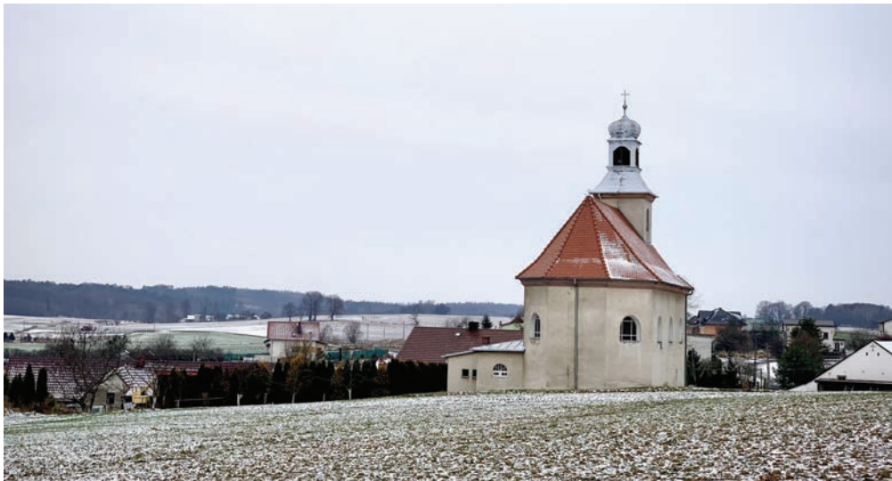
Kościół filialny pw. św. Anny w Ligocie Toszeckiej.

w Paczynie, kolejny etap termomodernizacji budynku świetlicy w Sarnowie, brukowanie placu rekreacyjno-sportowego w Ciochowicach, „zielona klasa” w SP nr 1 w Toszku, zagospodarowanie terenu przy remizie OSP w Toszku, remont łazienek w świetlicy w Pniowie, doposażenie placu