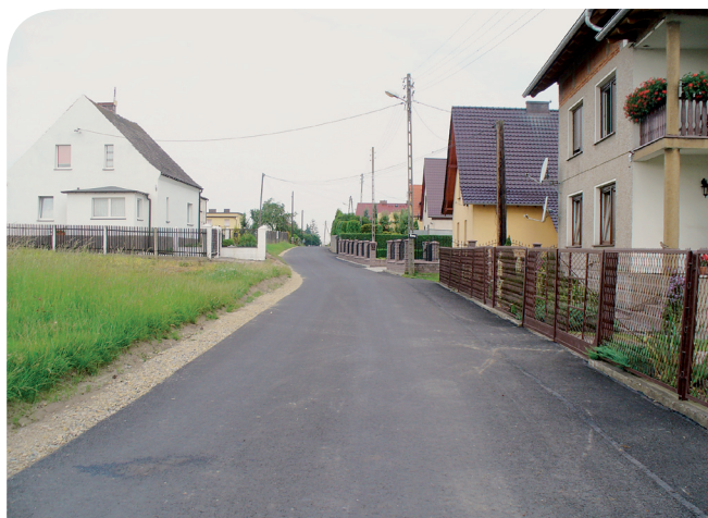
ul. Szkolna w Ciochowicach po przebudowie