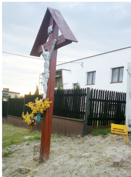
Krzyż przy ul. Kolejowej

Wszystkim tym, którzy pomagali i zaangażowali się w prace serdecznie dziękujemy i liczymy na dalszą współpracę.