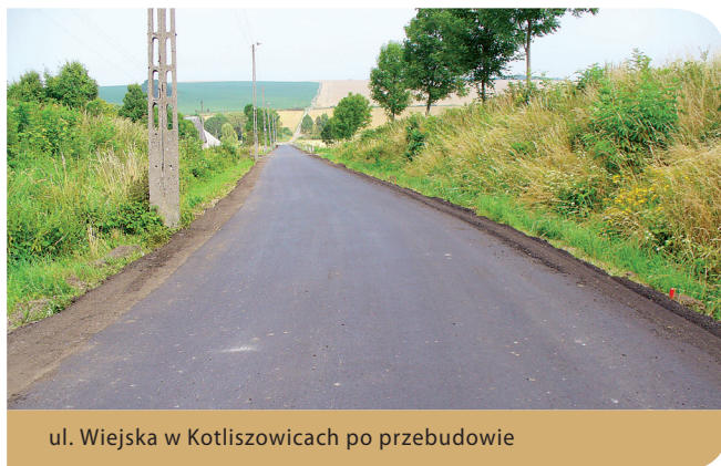
ul. Wiejska w Kotliszowicach po przebudowie

gości 0,71 km, z obustronnymi poboczami. Łączny koszt inwestycji, obejmujący opracowanie dokumentacji projektowej, realizację przedsięwzięcia budowlanego oraz nadzór