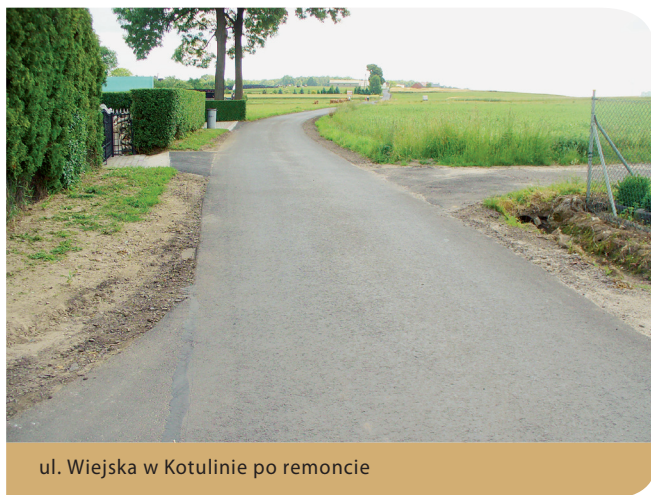
ul. Wiejska w Kotulinie po remoncie

inwestorski, opiewał na kwotę ponad 130 tys. złotych.