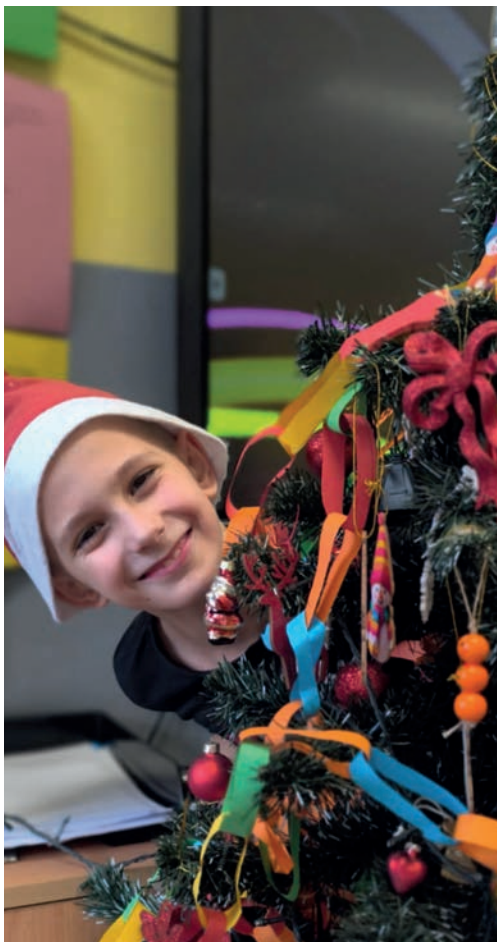
„Lubię Święta za wspólne kolędowanie i rodzinne ubieranie choinki.”