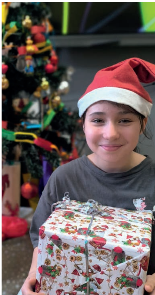
„Lubię Święta, bo są prezenty i miło spędzam czas z rodziną”