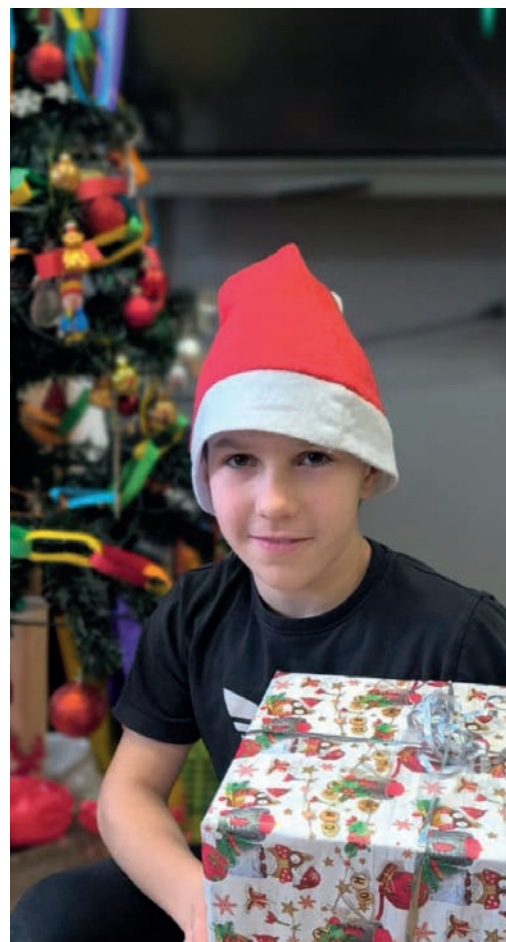
„Kocham świąteczny klimat i dzielenie się opłatkiem.”