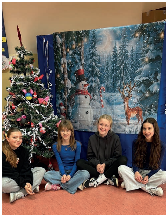
Dziewczyny z 6b:

Szkoła Podstawowa nr 2 im. Gustawa Morcinka w Toszku