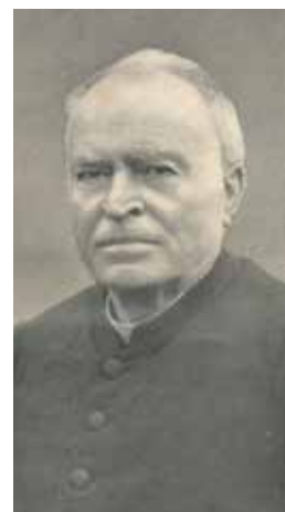
Zbiory Muzeum w Gliwicach