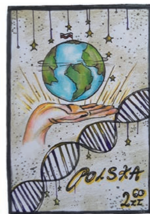
projekt znaczków: Maciek Segiet