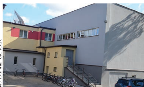
Szkoła Podstawowa w Paczynie przed i po termomodernizacji.

Do inwestycji proekologicznych, które zostały już zrealizowane, należą kompleksowe termomodernizacje dwóch obiektów oświatowych: Przedszkola w Toszku i Szkoły Podstawowej w Paczynie (2015) oraz modernizacja systemu ogrzewania na Zamku w Toszku (2017). W obydwu budynkach oświatowych prace obejmowały nie tylko docieplenie elewacji, ale także wymianę źródła ciepła i montaż kolektorów słonecznych. Wymierne korzyści, jakie przyniosły te inwestycje, nie licząc efektów ekologicznych (ograniczenie niskiej emisji), polegają na znacznej obniżce kosztów ogrzewania szkoły w Pa-