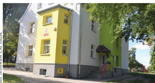
Przedszkole przed i po termomodernizacji.