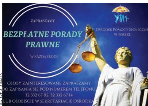
fol. OPS Toszek

Toszecki Ośrodek Pomocy Społecznej udziela bezpłatnych porad w Punkcie Nieodpłatnej Pomocy Prawnej. Mając na uwadze indywidualne podejście do klienta i duże zainteresowanie bezpłatnymi poradami, należy wcześniej zapisać się telefonicznie - 32 332 67 02, 32 332 67 14 lub przyjść osobiście do sekretariatu Ośrodka przy ul. Rynek 11.