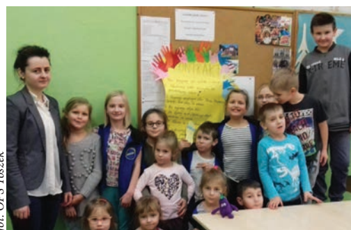
fol. OPS Toszek

Centrum Kultury „Zamek w Toszku” oraz Ośrodek Pomocy Społecznej przygotowali atrakcyjny program spędzania czasu wolnego w okresie ferii zimowych. Podczas dwutygodniowych spotkań prze-