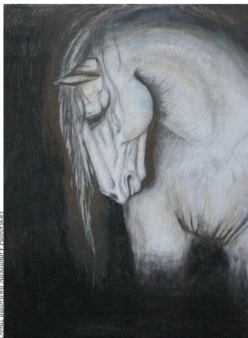
Obraz autorstwa Aleksandry Falborskiej