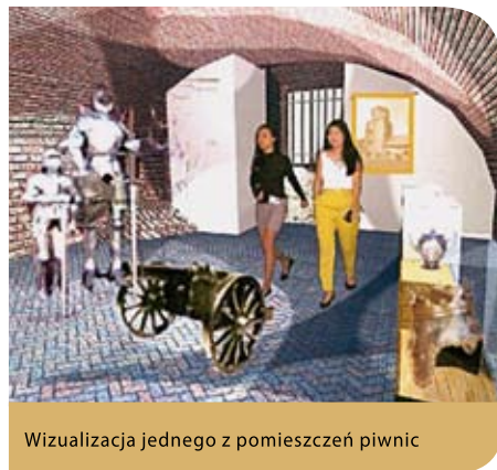
Wizualizacja jednego z pomieszczeń piwnic

Projekt przewiduje rozwiązania przyjazne dla osób niepełnosprawnych, a niewykorzystane dotąd powierzchnie wieży zyskają nowe funkcje użytkowe.