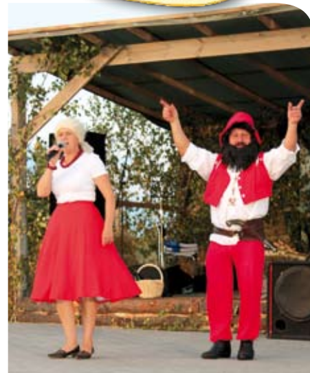
fol. M. Grobosz