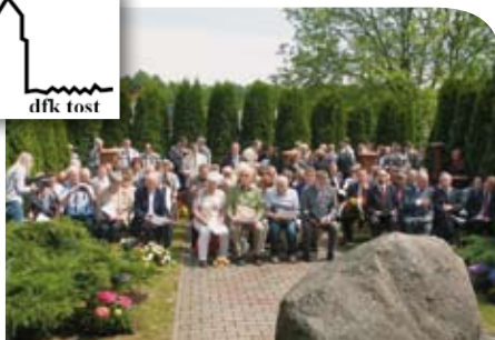
Uczestnicy uroczystości w maju 2011