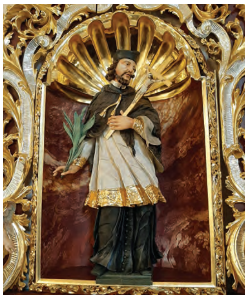
Ołtarz po renowacji

Zabytki sztuki i kultury łączą przeszłość z przyszłością, świadczą o naszych dziejach, mówią o czynach przodków, ich życiu, dążeniach i upodobaniach. Pod koniec października br. został odrestaurowany barokowy ołtarz św. Jana Nepomucena, który znajduje się w kościele w Toszku. Na ten cel parafia pozyskała środki z dotacji celowej z gminy Toszek, a także z Powiatu Gliwickiego. Realizacja zadania przyczyniła się do zachowania materialnego dziedzictwa historyczno-kulturowego naszej gminy. Gratulujemy księdzu proboszczowi kolejnej udanej inwestycji. JR