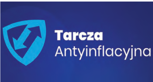
Tarcza antyinflacyjna czytaj na str. 3