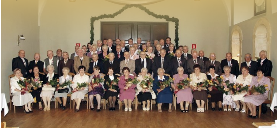
Na zdjęciu pary, które obchodziły jubileusz 50 i 60-lecia pożycia małżeńskiego.

Dla Diamentowych Jubilatów pamiątkowy medal ufundował Burmistrz Toszka. Pary małżeńskie otrzymały również listy gratulacyjne, upominki oraz bukiety kwiatów. Podczas toastu, wzniesionego tradycyjną lampką szampa, życzone seniorom, aby w zdrowiu i spokoju przeżyli razem każdy kolejny dzień.