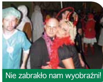
Nie zabrakło nam wyobraźni!

tego typu imprezie. Zabawę prowadził zespół „ATRIO”, który postarał się o dobry humor gości, organizował liczne konkursy, w których wszyscy chętnie brali udział. Organizatorzy składają podziękowania zespołowi, ale przede wszystkim uczestnikom balu, bo to dzięki ich obecności, poczuciu humoru i wspaniałej zabawie – imprezę tę można zaliczyć do udanych.