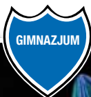
Złota maska dla Gimnazjum z Toszka