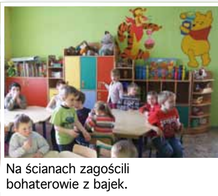
Na ścianach zagościł bohaterowie z bajki.