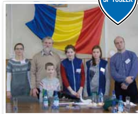
Toszanie odwiedzili rumuńskie Sacele

Zgodnie z harmonogramem działań projektu Comenius w dniach od 20 do 25 lutego 2 nauczycieli i 3 uczniów Szkoły Podstawowej w Toszku spotkało się z przedstawicielami szkół partnerskich w Sacele w Rumunii. Toszanie zwiedzili tamtejszą szkołę, miasto, zamek Drakuli i miasto Braszów, uczestniczyli w szkolnych zajęciach, poznali niektóre zwyczaje regionu, ale również opowiedzieli o swojej szkole i Toszku. W pamięci uczestników wycieczki pozostanie z pewnością wieczór przy ludowej rumuńskiej muzyce i gościnność gospodarzy.