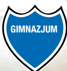
Jeden komputer na jednego ucznia...

W Gimnazjum im. I. Sendler w Toszku od kilku lat działają dwie nowoczesne pracownie komputerowe pozyskane z projektu MEN pt. „Pracownie komputerowe dla szkół”, a współfinansowane ze środków Europejskiego Funduszu Społecznego. Zostały one wyposażone w latach 2007 i 2008 w sprzęt o wartości 41 797,44 zł i 41 406,12 zł.