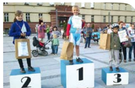
Toszecka Grupa Kolarska na podium

Kolarska zaprasza w poniedziałek, środę oraz piątek o godz. 16.30, zbiórka przy głównym wejściu do Szkoły Podstawowej w Toszku. Szczegółowe informacje można uzyskać pod nr. tel. 515 680 134. Najbardziej aktualne dane, wyniki, zdjęcia oraz filmiki dotyczące Toszeckiej Grupy Kolarskiej dostępne są pod adresem www.facebook.com/profile.php?id=100003863808913&ref=tn_tnmn .