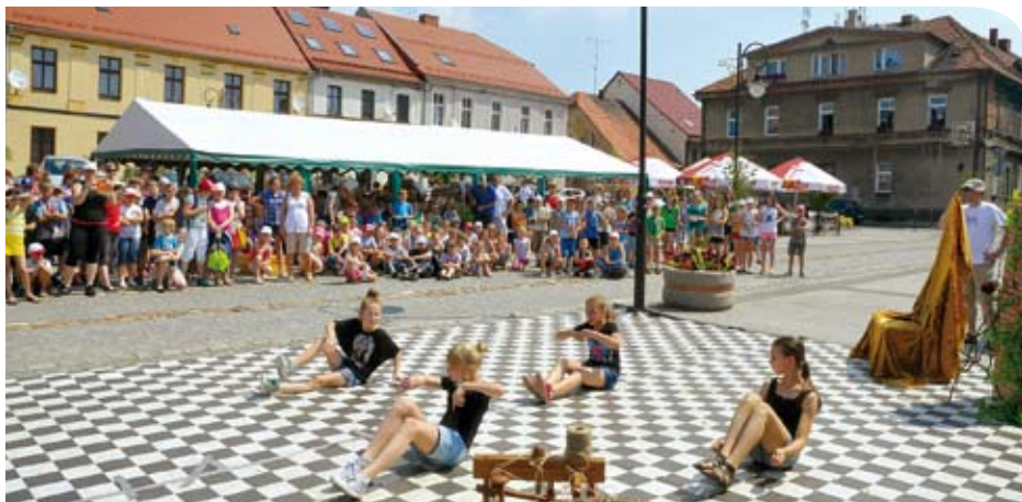
Musicalowa wersja „Śpiącej Królowej” w wykonaniu toszeckich gimnazjalistów