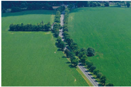
Prace przy drogach gminnych str. 3