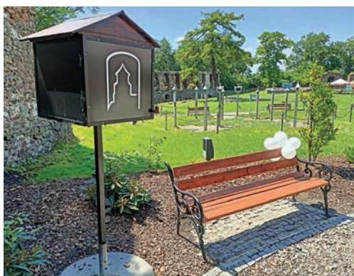
Zamkowy ogródek str.