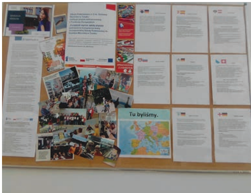
Europejski Wymiar Szkoły str. 5