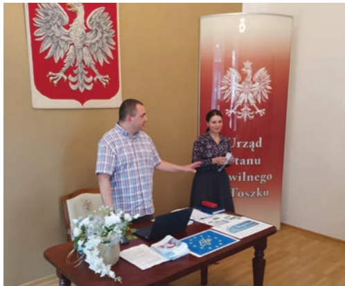
Przywracamy błękit str. 4