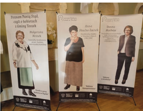
XII Toszecki Jarmark Adwentowy 2022 str. 3