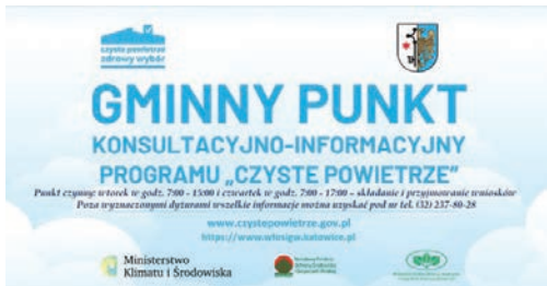
Czyste Powietrze str. 4