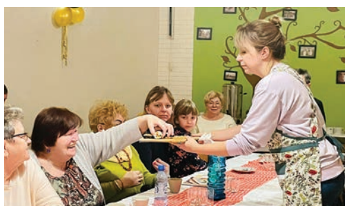
Smaki Korei w Paczynie str. 5