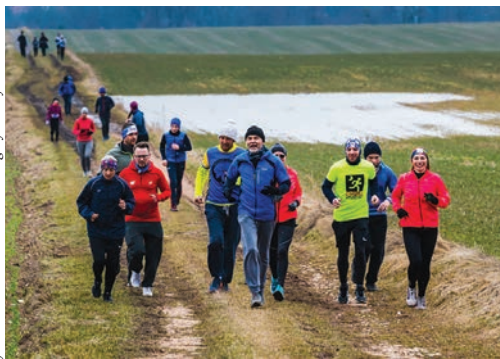
Bieg Wsparcia str. 4