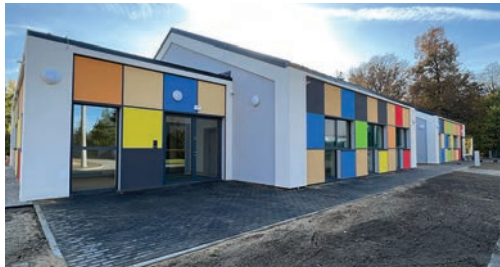
Przedszkole w Kotulinie str. 3

Toszek • Boguszyce • Ciochowice • Kotulin • Kotliszowice • Ligota Toszecka • Pacyzna • Paczynka • Pawłowice • Pisarzowice • Płużniczka • Pniów • Proboszczowice • Sarnów • Wilkowiczki