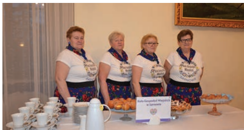
Powiatowy Festiwal Krepla str. 6