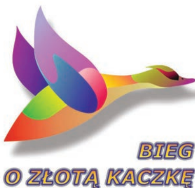
Bieg Żłotej Kaczki