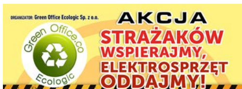
Wspierajmy OSP Ciochowice – zbiórka elektronarzędzi!