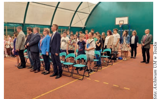
Podczas śpiewania hymnu szkoły w SP w Kotulinie.