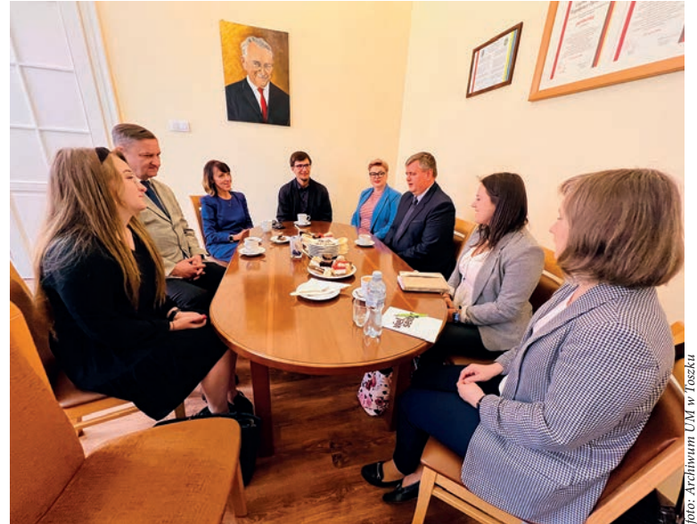
Spotkanie w gabinecie burmistrza.