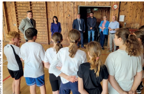
Lekcja wychowania fizycznego w SP w Paczynie.

– Gratuluję wam tak zdolnych uczniów. W szkole w Paczynie trafiłam m.in. na lekcję wychowania fizycznego, zobaczyłam