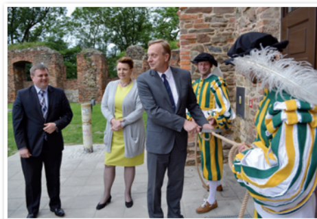
Zamkowa wieża dostępna dla zwiedzających